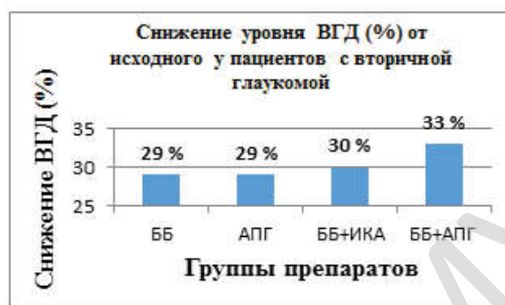
Рисунок 2. Снижение уровня ВГД (%) от исходного уровня при использовании различных групп препаратов у пациентов с вторичной глаукомой

При анализе гипотензивного эффекта препаратов у пациентов с ВГ при назначении монотерапии ББ и АПГ было выявлено, что уровень ВГД снизился на 29 % от исходного. При использовании фиксированной комбинации ББ/ИКА уровень ВГД снизился от исходного на 30 %, а ББ/АПГ — на 33 % (рисунок 2).