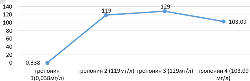
Рисунок 1 — Динамика изменения тропонина I

Важное диагностическое значение имеет тропонин Т и I. Сердечные тропонины характеризуются ранним повышением концентрации в крови после некроза миокарда, что позволяет осуществлять ретроспективную идентификацию поражения кардиомиоцитов. В клинической практике для диагностики чаще используют показатели тропонина I, потому что он имеет большую кардиоспецифичность по сравнению с тропонином Т. В норме его содержание не должно превышать 3,1 мг, но при ИМ через 2–6 ч его содержание в крови повышается в 300–400 раз и нормализуется только через 10–14 дней [1]. На рисунке 1 изображены общие значения тропонина I, где тропонин 1 (1–2 ч после ИМ), тропонин 2 (5–6 ч после ИМ), тропонин 3 (12–13 ч) и тропонин 4 (18–20 ч). В первые 1–2 ч содержание тропонина соответствует норме, затем через 4–5 ч наблюдается его увеличение в 352 раза. В дальнейшем концентрация тропонина в крови слегка повышается (на 9,7 ед.), а затем незначительно снижается (на 25,8 ед.).