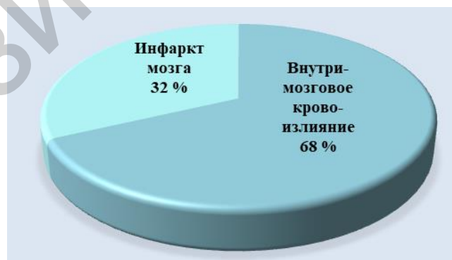
Рисунок 1 — Структура причин смерти пациентов в текущем исследовании

В структуре причин смерти внутримозговое кровоизлияние случилось у 19 (68 %) человек, а инфаркт мозга у 9 (32 %) человек (рисунок 1).