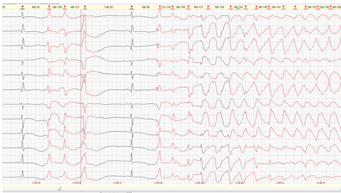
Рисунок 2 — Эпизоды веретенообразной ЖТ с максимальной ЧСС до 278/мин в пароксизмах (фрагмент холтеровского мониторинга)

На основании клинико-анамнестических и функционально-диагностических данных выставлен клинический диагноз: Врожденный синдром удлиненного интервала QT с пароксизмами желудочковой тахикардии, синкопальными состояниями, состояние после клинической смерти на фоне пароксизма полиморфной желудочковой тахикардии, фибрилляции желудочков.