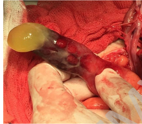
Рисунок 2 — Грыжевое содержимое (острый гангренозный аппендицит)

Послеоперационный период протекал без особенностей, рана зажила первичным натяжением. Швы сняты на 9-е сутки. Проводилось обезболивание, антибиотикотерапия (цефтриаксон), инфузионная терапия, уход за раной, введение 3000 МЕ ПСС по Безредко и 0,5 СА. Отмечалось положительная динамика в ОАК от 13.06.17 RBC — 4,35 \times 10^{12}/л ; Hb — 132 г/л; PLT — 166 \times 10^9/л ; WBC — 9,8 \times 10^9/л .