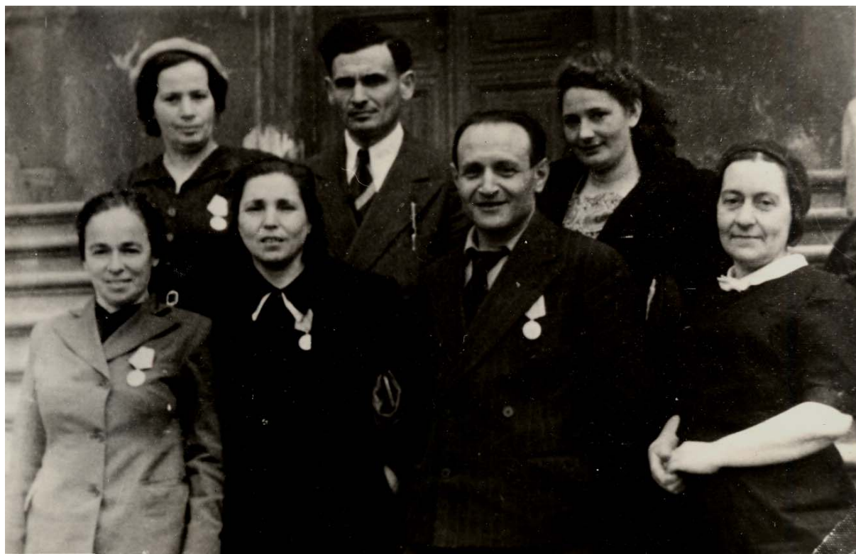
Рисунок 6 — Врачи-партизаны участники съезда врачей-партизан. Минск, 1945 г