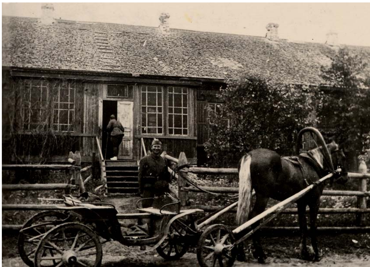
Рисунок 1 — Партизанский край в тылу у немцев. Внешний вид больницы для партизан. Витебская область