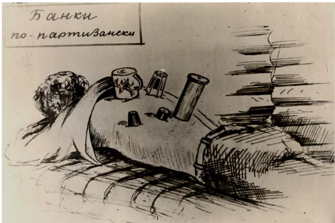
Рисунок 16 — Фото с картины художника-партизана Липень М. «Банки по-партизански». Рогачевская партизанская бригада