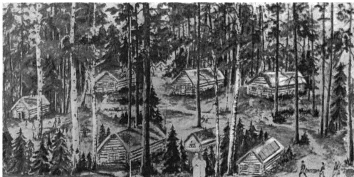
Рисунок 20 — Партизанский госпиталь бригады «Дяди Коли» у озера Палик