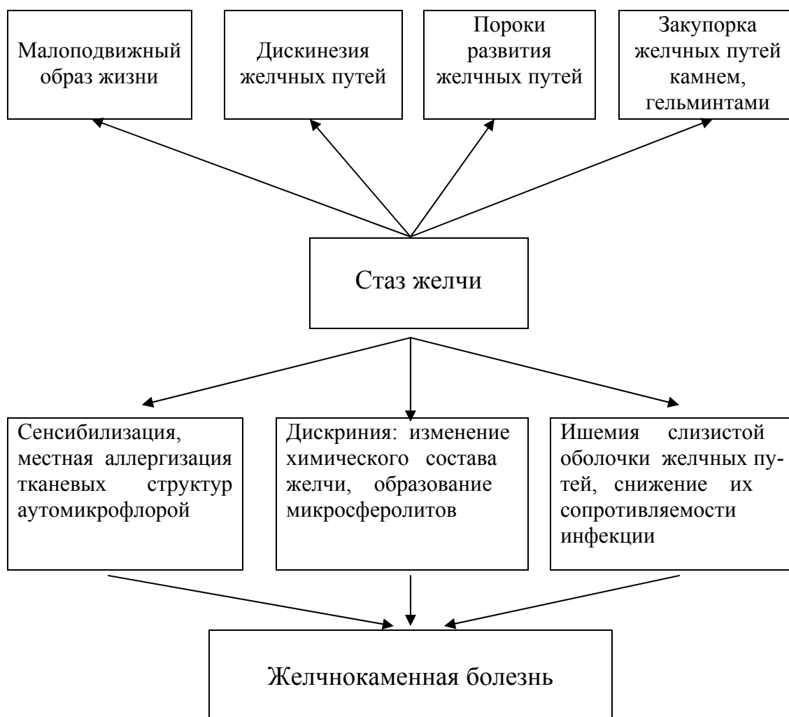
Рис. 2. Патогенез желчнокаменной болезни.

Предрасполагающими факторами являются наследственно обусловленная дисхолия, ожирение, гипотиреоз, сахарный диабет, отягощенная наследственность, заболевания печени, аномалии развития билиарной системы, избыточное употребление богатой жирами и холестерином пищи, гиповитаминоз А.