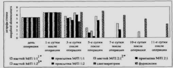
Рисунок 2 – Степень микробной обсемененности ран, инфицированных S. aureus

При моноинфекции, вызванной стафилококками, антимикробный эффект от применения средства «ФитоМП» наблюдался уже через сутки от начала лечения. Местная и общая картина через 2-е суток лечения характеризовалась исчезновением воспалительного процесса и гиперемии в окружности ран, уменьшением обсемененности (до 10^3 на 1 г ткани) или полным исчезновением гнойного отделяемого, очи-