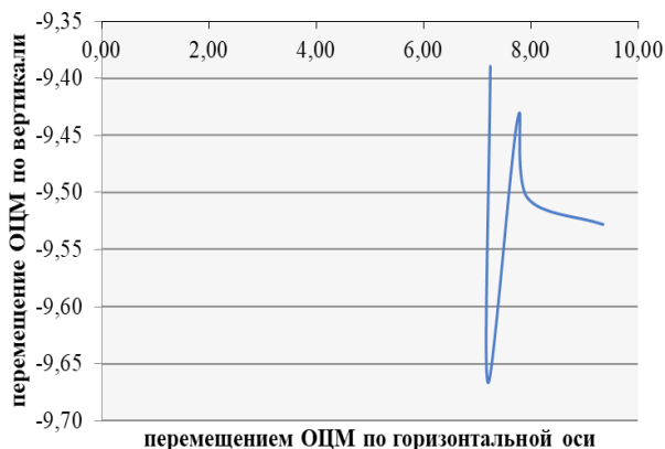
Рис. 1. Траектория ОЦМ при выполнении подачи в прыжке

На графике рисунка 1 показана траектория перемещения общего центра масс спортсмена (ОЦМ) в двух направлениях X и Y. Синяя кривая представляет собой тренд перемещения ОЦМ в различных фазах движения.