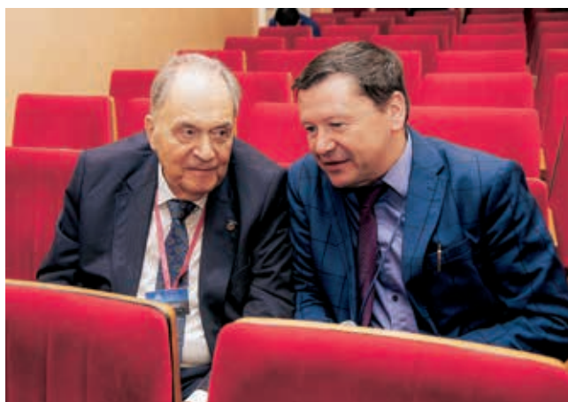
Диалог в ожидании Конференции: беседа о народонаселении России академика Г. А. Софронова и члена-корр. К. В. Жданова

Организационный комитет представил для обсуждения научной общественности несколько выпускаемых научных журналов, в которых рассматриваются наиболее важные вопросы эпидемиологии, инфектологии и иммунитета: