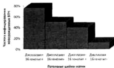
Рисунок 3 – Частота инфицирования новорожденного ВПЧ в зависимости от наличия дисплазии и выделения 16 генотипа из шейки матки роженицы

Дисплазия+ – наличие дисплазии шейки матки у роженицы, дисплазия- – отсутствие дисплазии шейки матки у роженицы, 31 генотип+ – положительный результат ПЦР, 31 генотип- – отрицательный результат ПЦР