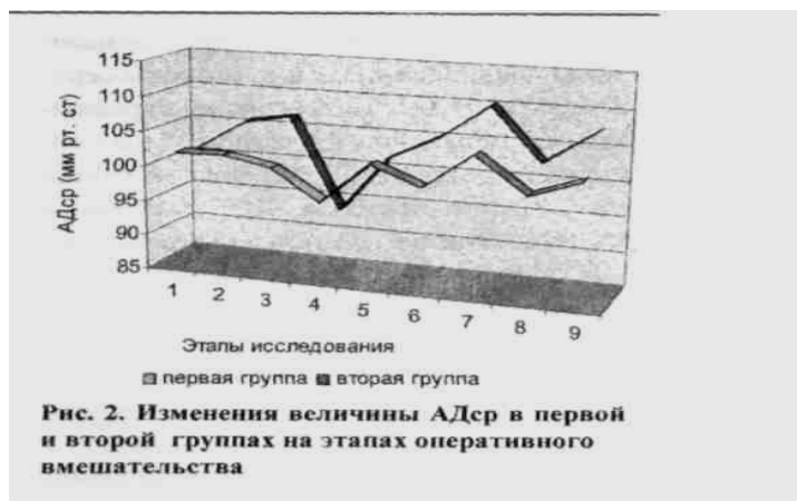
Рис. 2. Изменения величины АДср в первой и второй группах на этапах оперативного вмешательства

ционной подготовке позволяет уменьшить прирост показателей САД, ДП и ЧСС, наблюдаемых на этапе удаления матки, и тем самым способствует ограничению стрессорных изменений гемодинамики на наиболее травматическом этапе операции.