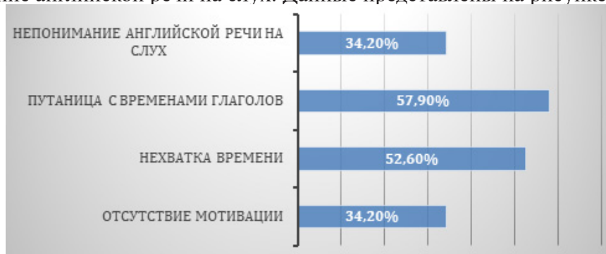
Рисунок 2 – Каковы трудности, с которыми вы сталкиваетесь при изучении английского языка?

Также студентам был задан вопрос «Каковы трудности, с которыми вы сталкиваетесь при изучении английского языка?» 57,9 % респондентов проголосовали за то, что у них происходит путаница с временами глаголов, 52,6 % опрошенных высказали за то, что у них нехватка времени, а 34,2 % студентов отдали свои голоса за отсутствие мотивации и непонимание английской речи на слух. Данные представлены на рисунке 2.