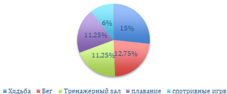
Рисунок 2 – Ответ на вопрос «Какой вид физической активности во внеучебное время наиболее привлекателен для Вас?»

В вопросе предпочтительного характера физической активности мнения разделились следующим образом: большинство 15 % (20 человек) отдадут предпочтение ходьбе, 12,75 % (17 человек) предпочитают бег другим видам физической активности, 11,25 % респондентов (15 человек) назвали наиболее предпочитаемым видом физической активности занятия в тренажерном зале. Еще 11,25 % (15 человека) выбрали плавание, 6 % (8 человек) спортивные игры. Результаты представлены на рисунке 2.