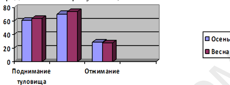
Рисунок 1 — Количественные показатели

Результаты представлены на рисунках 1, 2.