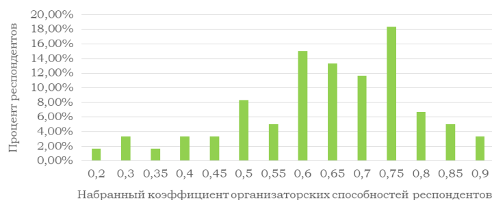
Рисунок 2 — Степень выраженности организаторских способностей в группе респондентов