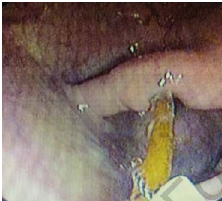
Рисунок 4. Тракция ВМС Figure 4. IUD traction