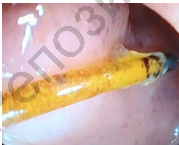
Рисунок 1. Место внедрения ВМС в просвет сигмовидной кишки Figure 1. Site of IUD insertion into the lumen of the sigmoid colon

Пациентка Ф., 51 год, направлена на плановую колоноскопию в связи с длительно беспокоящими болями и дискомфортом внизу живота. При выполнении видеокколоноскопии 12.11.2021 г. в сигмовидной кишке на расстоянии 45 см от ануса (долихосигма) обнаружено инородное тело (ВМС) диаметром 3 мм и длиной до 20 мм, коричневого цвета, выступающее в просвет кишки (рисунки 1 и 2).