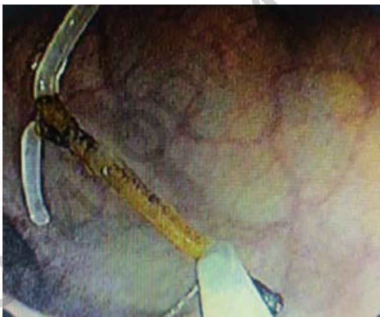
Рисунок 5. ВМС полностью в просвете кишки Figure 5. IUD completely placed in the lumen

При контрольном осмотре места внедрения инородного тела кровотечения не отмечено, при инсуффляции воздухом просвет кишки хорошо расправляется, у пациентки при этом не было болевого синдрома, что указывало на отсутствие сообщения со свободной брюшной полостью (рисунок 6). Дефект кишки в месте нахождения ВМС имел щелевидную форму и не клипировался. По-