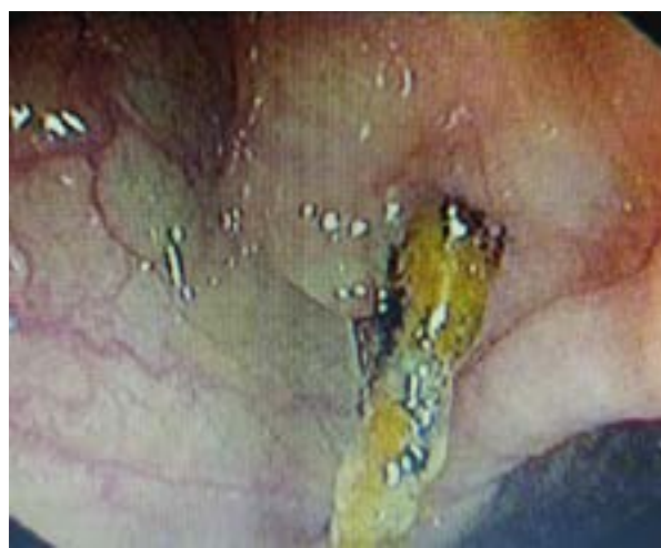
Рисунок 2. Дистальный конец ВМС в просвете сигмовидной кишки Figure 2. Distal end of the IUD in the lumen of the sigmoid colon