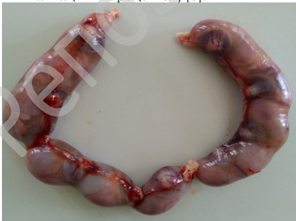
Рисунок 1. Рога матки крысы контрольной группы с плодами с плодами Figure 1. Horns of the rat's uterus in the control group with fetuses

Для определения влияния термической травмы на плод вскрывали рога матки и регистрировали число мест имплантации, число живых, мертвых, резорбированных плодов, а также определяли число желтых тел беременности в обоих яичниках. Эмбрионы тщательно осматривали на наличие внешних аномалий развития, определяли массу плодов (рисунки 1 и 2). В дальнейшем рассчитывали преимплантационную смертность плодов (разность между числом желтых тел в яичниках и числом мест имплантации в матке от общего числа желтых тел в процентах) и постимплантационную смертность плодов (разность между числом мест имплантации и числом живых плодов в матке от числа мест имплантации в процентах) [8].