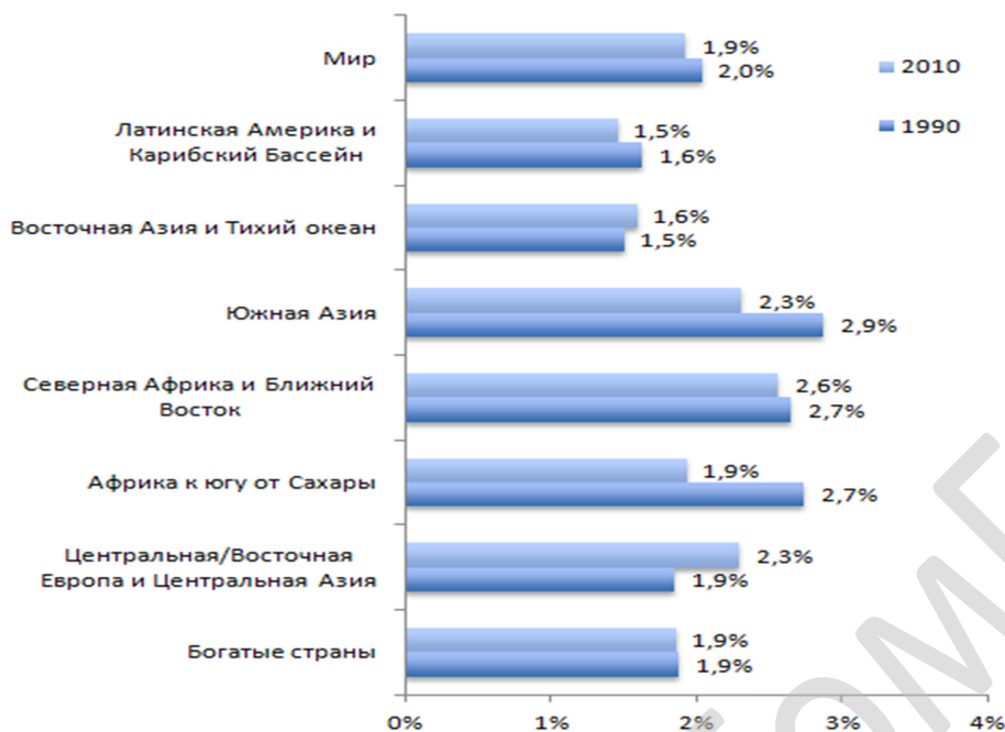
Рисунок 1 — Распространенность первичного бесплодия среди женщин в возрасте 20–44 года