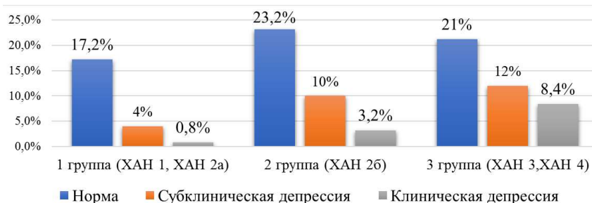
Рисунок 5 – Распределение пациентов в зависимости от степени ХАН и выраженности депрессии, %

Согласно результатам проведенного исследования, тип личности Д был выявлен у 51,2 % пациентов (128 случаев). Среди женщин тип личности Д был выявлен в 56,7 % случаях (33 пациента), среди мужчин – в 49,5 % случаев (95 пациентов) ( p = 0,3 ). Среди пациентов 1-й группы (ХАН 1, ХАН 2а) тип личности Д присутствовал у 51 % пациентов (28 случаев), у пациентов 2-й группы (ХАН 2б) тип личности Д был у 41,8 % пациентов (38 случаев), среди пациентов 3-й группы (ХАН 3, ХАН 4) – у 59,6 % пациентов (62 случая).