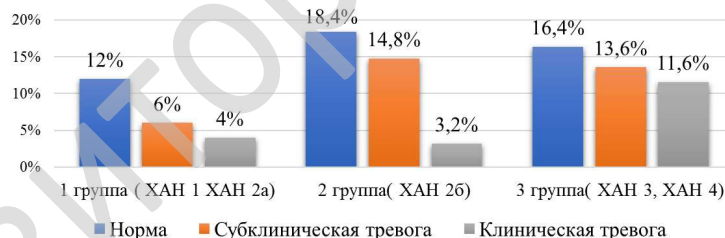
Рисунок 4 – Распределение пациентов в зависимости от степени ХАН и выраженности тревоги, %

Среди пациентов 3-й группы тревога разной степени выраженности была выявлена у 60,6 % пациентов (63 случая), при этом клинически значимого характера - у 46 % респондентов (29 пациентов), тревожные проявления у 39,4 % пациентов (41 случай) отсутствовали. Среднее количество баллов по подшкале HADS-A у пациентов 3-й группы составило 8,0 (5,0; 11,0) баллов ( W = 0,97 , p = 0,036 ) (рисунок 4). Различие средних значений баллов по подшкале HADS-A у пациентов трех групп статистически значимо ( H = 8,78 , p = 0,012 ).