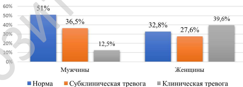
Рисунок 2 – Распределение пациентов по выраженности тревоги у мужчин и женщин, %

ния тревоги разной степени выраженности наблюдались в 48,9 % случаях (94 пациента) (рисунок 2). Среднее количество баллов по подшкале HADS-A у пациентов с заболеванием периферических артерий составило 8,0 (5,0; 9,0) ( W = 0,96 , p < 0,01 ). Среднее значение баллов по подшкале HADS-A у женщин составило 9,0 (5,0; 12,0) ( W = 0,95 , p = 0,25 ), у мужчин – 7,0 (5,0; 9,0) ( W = 0,96 , p < 0,01 ). Различие средних значений баллов по подшкале HADS-A у женщин и мужчин статистически значимо ( U = 3845 , p < 0,0004 ).