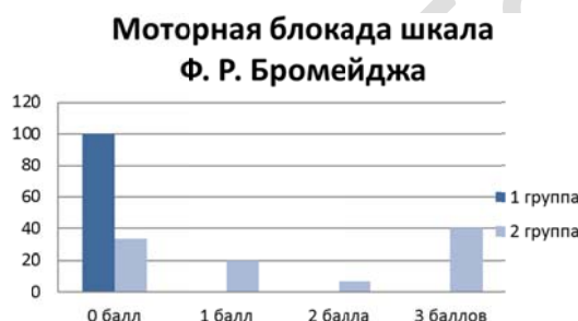
Рисунок 4 — Оценка уровня моторного блока у пациентов двух клинических групп

Для оценки и сравнительного анализа моторной блокады использована шкала Ф.Р. Бромейджа. Данные, полученные в ходе исследования, представлены на рисунке 4.