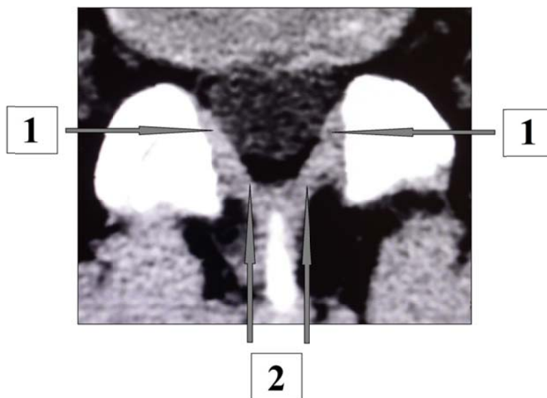
1 — зона латеральной флавэктомии; 2 — зона медиальной флавэктомии

При определении длины зоны флавэктомии учитывали краниально-каудальную протяженность костного окна и резецировали ту часть желтой связки, которая, согласно расчету, попадала в его проекцию. Расчет зон латеральной и медиальной флавэктомии показан на рисунке 2.