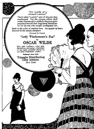
Рис. 2. Постер к фильму «Веер леди Уиндермир» (1916)

туберкулеза [25, 26]. В такой ситуации микобактериоз длительное время может скрываться под маской обострения и прогрессирующего течения фонового заболевания, в том числе рецидива туберкулеза. К отдельной клинической ситуации следует отнести и генерализованную НТМ-инфекцию у ЛЖВ, влияющую на прогноз и исход заболевания [23].