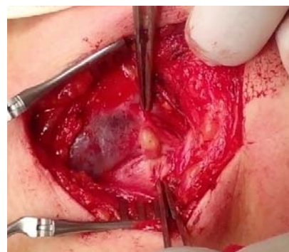
Рисунок 4 — Плотное образование размером 2×1 см