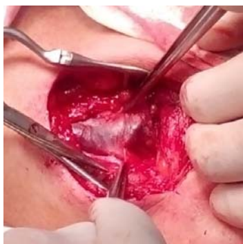
Рисунок 3 — Место впадения лицевой вены

Капсула отделена от наружной поверхности вены без вскрытия просвета (рисунок 6).