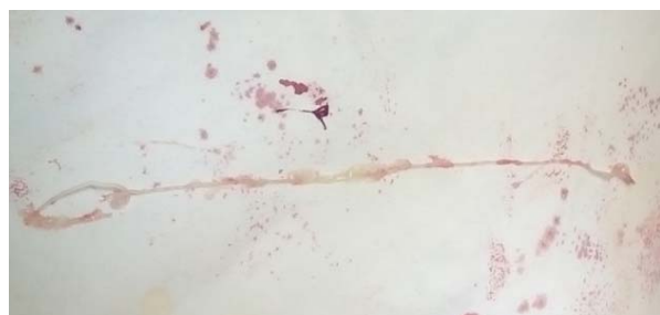
Рисунок 5 — Извлеченный круглый червь