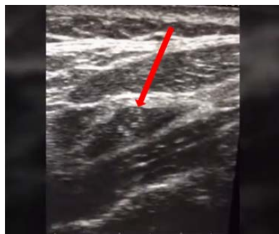
Рисунок 1 — УЗИ-картина образования внутренней яремной вены слева

мм, признаков инвазии в окружающие структуры не отмечается. При проведении УЗИ сердца выявлена диастолическая дисфункция 1-го типа левого желудочка и незначительная регургитация на итральном и трикуспидальном клапанах. В остальных анализах отклонений не выявлено.