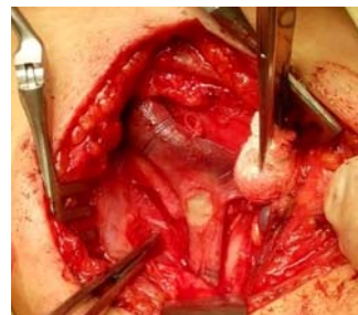
Рисунок 6 — Участок вены после удаления паразитарной капсулы