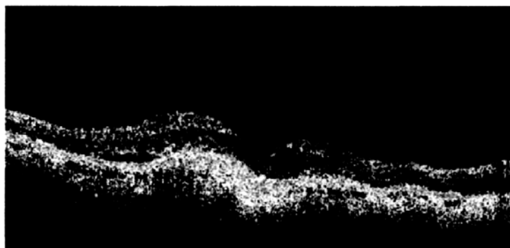
Рис. 1 Пациент М., 58 лет. ОКТ ОД через 3 дня после операции ФЭК

Из приведенной таблицы видно, что в результате приема Окувайт-Лютеина средние показатели толщины макулярной зоны сетчатки в основной группе уменьшились на 33μ в сравнении с 23μ контрольной группы, а средний объем макулярной зоны сетчатки уменьшился на 1,301 мм 3 в сравнении с 1,266 мм 3 (P<0,001) контрольной группы.