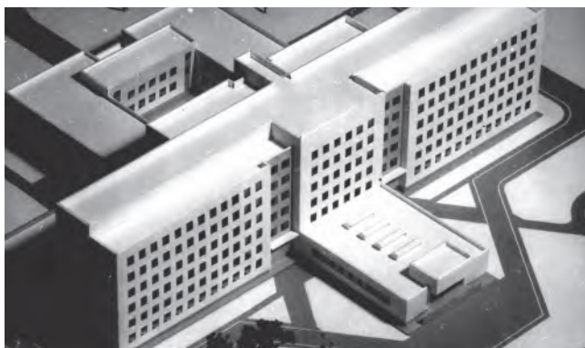
Рис. 5. Макет здания кожвендиспансера на ул. Медицинской, 10 Fig. 5. Layout of the dermatological clinic building at 10 Medical Street