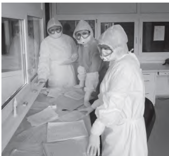
Рис. 11. Пандемия COVID-19. Тяжелые рабочие будни Fig. 11. COVID-19 Pandemic. Hard working days

С 2022 года в диспансере функционирует кабинет профилактики злокачественных новообразований кожи. В рамках работы кабинета врачи-специалисты широко используют выездную форму работы – профилактические осмотры организуются на предприятиях, в организациях, а также в ЦРБ Гомельской области, что позволяет расширить доступность медицинской помощи жителям самых отдаленных мест региона (рис. 12).