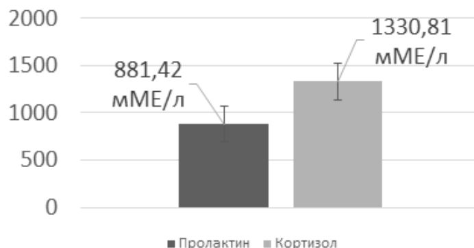
Рисунок 3 – Уровень пролактина и кортизола у женщин с аденомой гипофиза

Анализ показателей гормонов у женщин выявил отклонение пролактина в сторону увеличения среднее значение до 881,42 мМЕ/л при норме 102–496 мМЕ/л. Показатели кортизола так же увеличены и составляют 1330,81 ммоль/л при норме 75–300 ммоль/л.