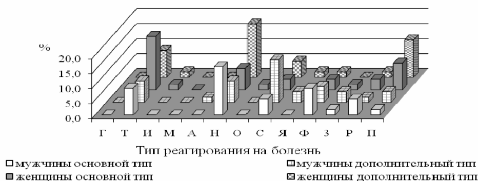
Рисунок 2 — Показатели типа реагирования на болезнь по опроснику ЛОБИ у мужчин и женщин с артериальной гипертензией

Анализ картины болезни у мужчин и женщин показал различие в типах реагирования на болезнь. При этом у мужчин основным типом реагирования был неврастенический — у 9 (16,1 %) человек, а дополнительным — сенситивный — у 8 (14 %) человек; у женщин основной — тревожный — у 10 (18 %) человек, а дополнительный — неврастенический — у 10 (18 %) человек. Показатели отмечаемых в опроснике типов отношения к болезни у мужчин и женщин с АГ, характеризующие состояние психологической защиты, в обеих группах представлены на рисунке 2.