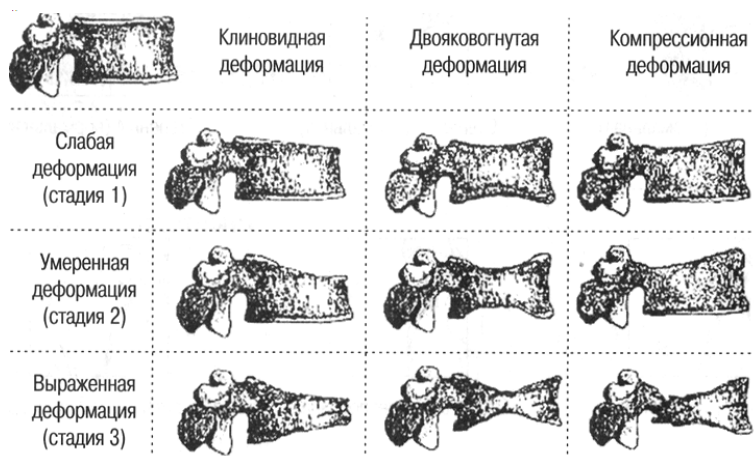
Рисунок 1 — Виды деформаций позвонков по Генанту

Классификации степени деформации тел позвонков по Генанту представлена в таблице 3.